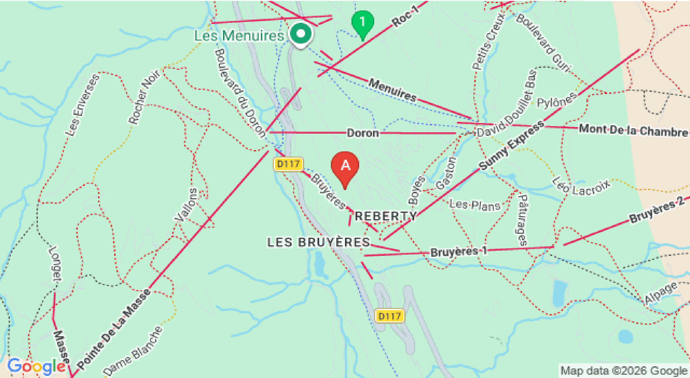
Map data ©2026 Google